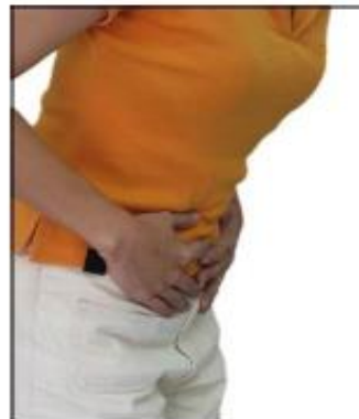
تکلی ۲: احساس درد در نواحی پایین تن که از علائم شایع کیست تخمدان است.